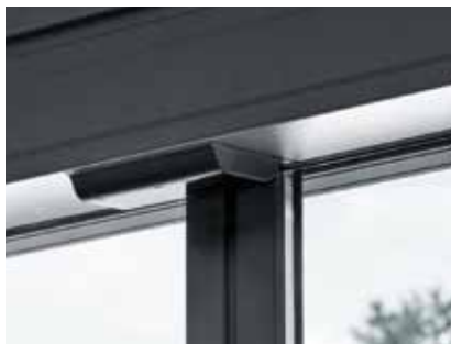
Combi-Scan: praktisch unsichtbar im Antriebsträger und Sturzprofil einbaubar.

Für die optionale Absicherung des seitlichen Türbereichs sorgt der im LANGE Schiebeporzellantrieb SLX-M eingebaute Side-Scan. Er schützt die Personen im Bewegungsbereich der sich öffnenden Türflügel. Der optionale Einsatz von Schutzflügeln verhindert das Abstellen von Gegenständen im Bewegungsbereich des Schiebeporzells.